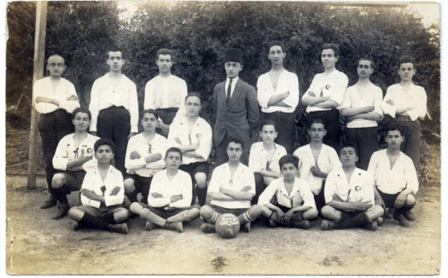
Resimde Beden Eğitimi Öğretmenleri ile birlikte, 1921 Yılıın Başarılı Futbol takımı Antalya Sultanisi (Lisesi)

Antalya Sultanisi öğrencileri, 1921 yaz tatilinde yapılan okullar arası futbol müsabakalarında oldukça sivrilmışlerdir.[7] Bugün bu gençleri, Milli Futbolcumuz Burak YILMAZ ’ la birlikte Antalya Liseli diğer sporcularımız temsil etmektedir.